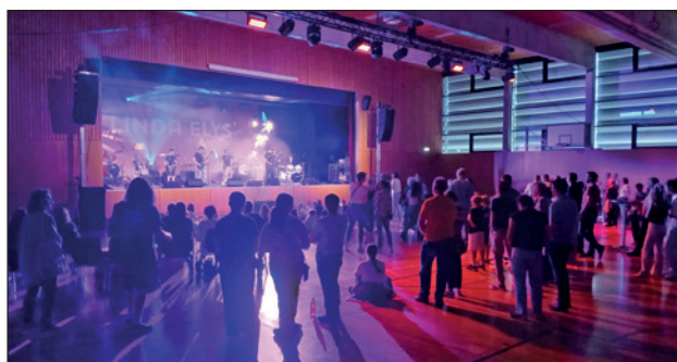
MZH Linde, perfekte Kulisse für einen Live-Auftritt

Pünktlich um 19.30 Uhr öffneten sich die Türen, und die Musikfans strömten neugierig in die Halle. Die Bar war von Beginn weg stark frequentiert, während sich eine gespannte Erwartung im Raum ausbreitete.