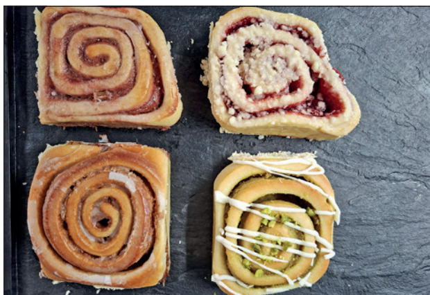
In der Haltestelle Millefeuille gibt's stets leckere Genüsse wie diese Schnecken-Vielfalt