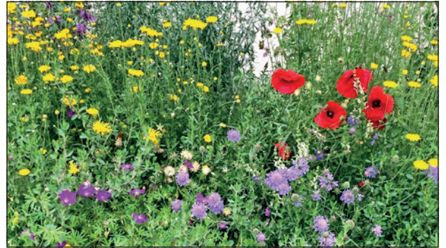
Schon im ersten Jahr blühen Wildstauden, und dann immer wieder.

Wildstauden sind in Gärten besonders wert- und sinnvoll, weil sie für einheimische Insekten Nahrungsquelle sind, die Artenvielfalt im Garten fördern und robust und pflegeleicht sind. Im Frühling 2027 werden Sie zu Wildstauden einen Vortrag besuchen und auch Wildstauden über die AG Biodiversität beziehen können.