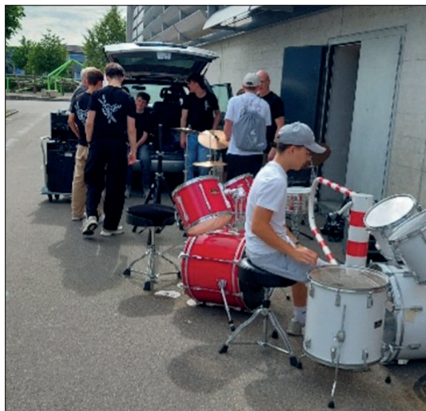
Die Band KISUM ist eingetroffen