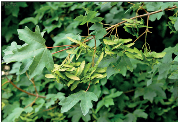
Der Feldahorn ist hitzeverträglich, windfest und wärmeliebend

Die Auswirkungen der Klimaerwärmung sind auch im Siedlungsraum, im Garten und auf dem Balkon festzustellen. Welche Möglichkeiten bieten sich, diese Veränderung positiv aufzunehmen und den Garten und Balkon fit für die Zukunft naturnah zu gestalten? Welche Baumarten bringen Kühlung und sind für die kommenden klimatischen Bedingungen geeignet?