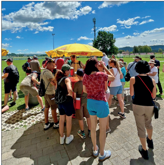
An fünf Posten wurden Kontakte geknüpft und es wurde sich rege ausgetauscht