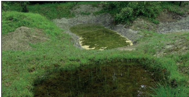
Frisch abgedichteter und «alter» Teich

Wir sind auf viele freiwillige Helferinnen und Helfer angewiesen und freuen uns auf deine Anmeldung. Ob Vereinsmitglied oder nicht, alle sind willkommen!