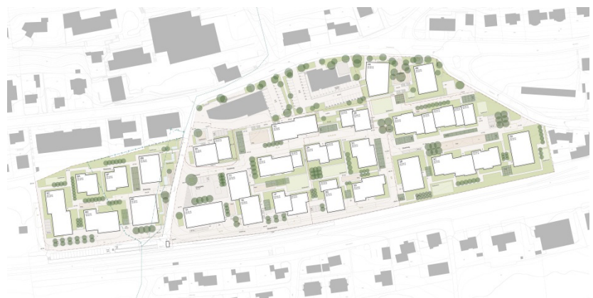
Projektidee Glasi Wauwil

Dieses Projekt wurde intensiv weiterentwickelt und bildet die Grundlage für den Richtplan Glasi.