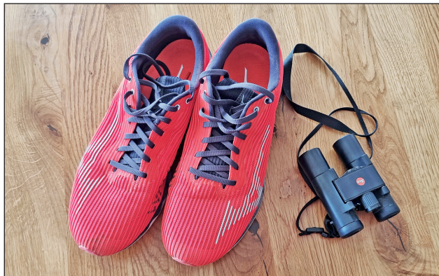
Zwei wichtige Utensilien fürs Ornithojogging

Am 25.5. ist der Start um 08.00 Uhr bei der Pfahlbausiedlung, Bahnhof Wauwil. Schluss ist um 10.30 Uhr beim Beobachtungsturm. Der Anlass findet nur bei sehr schlechtem Wetter nicht statt und ist für die ganze Familie geeignet.