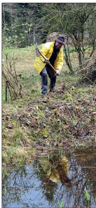
Mit viel Handwerk wurde das Lättloch gepflegt.