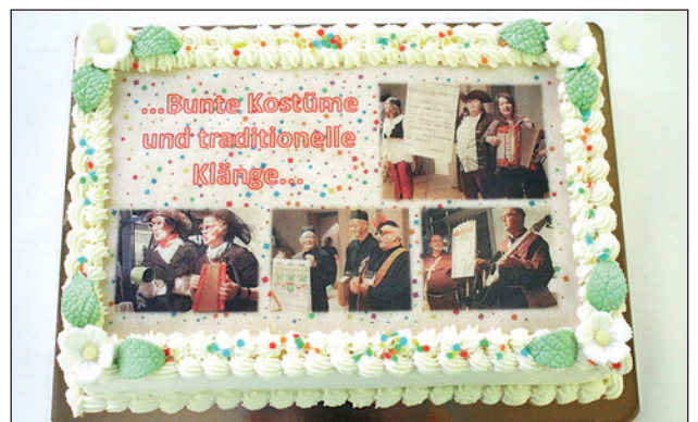
Die kreative Dekortorte mit den Konterfeis der vier Schnitzelbankgruppen zum Dank.