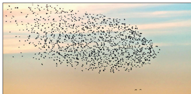
Vogelzug der Stare

Anschliessend nach dem Vortrag findet um 20.00 Uhr die GV vom NAVO statt.