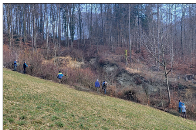
HelferInnen bei der Heckenpflege 2023 in der Sandgrube.

Anmeldung: bis Mittwoch 20. März 2024 bei Roman Erni, 079 464 16 62 oder naturschutz@navowauwil.egolzwil.ch