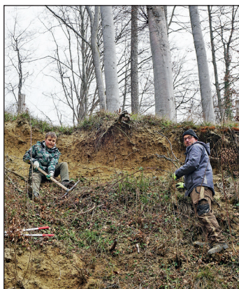
Pflegeinsatz Sandgrube 2022

Ein solcher Anlass wäre ohne Helfereinsatz gar nicht möglich. Deshalb gilt ein grosses DANKE SCHÖN an alle Helfer und Helferinnen, welche dazu beigetragen haben, diesen Anlass erfolgreich über die Bühne zu bringen. Ebenfalls ein riesiges DANKE SCHÖN an das OK, welches im Vorfeld und auch im Nachgang einige Arbeiten ausführen musste. Wir freuen uns auch im kommenden Dezember 2024 wieder ein spannendes und erfolgreiches Auto-Lotto durchführen zu dürfen.